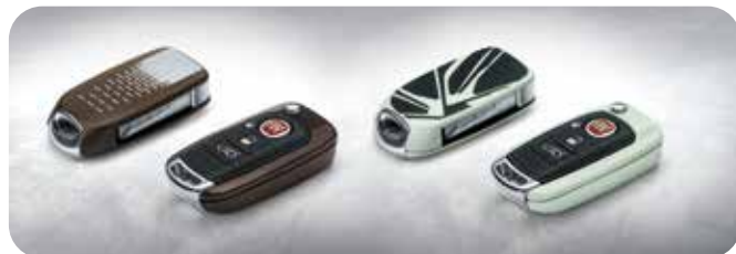
Mat Brons-Zilver & Lichtgevend Wit-Zwart 50927704