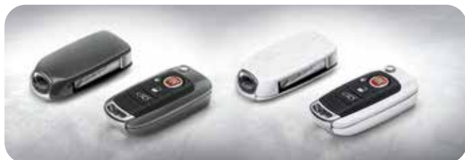
Gloss Grijs & Wit-Zilver 50927850