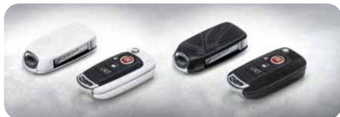
Mat Wit-Zilver & Gloss Zwart 50927705