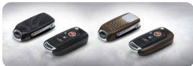
Glanzend Zwart & Mat Brons-Zilver 50927702