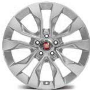
16" lichtmetalen velgen 6002093091 € 1.500,-