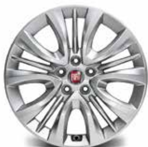
16" lichtmetalen velgen 6002093036 € 1.475,-