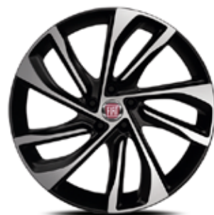
18" lichtmetalen velgen 6002093092 € 1.620,-