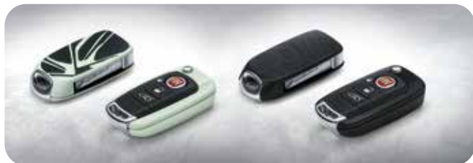
Lichtgevend Wit-Zwart & Mat Zwart 50927703