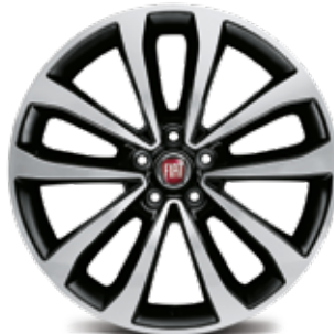
17" lichtmetalen velgen 6002093037 € 1.740,-