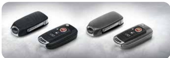
Mat Zwart & Gloss Grijs 50927701